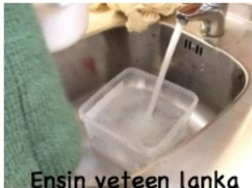
Ensin veteen lanka