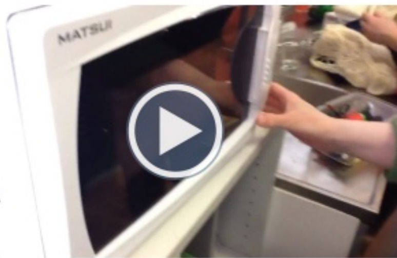
Tältä näyttää lanka mikron jälkeen