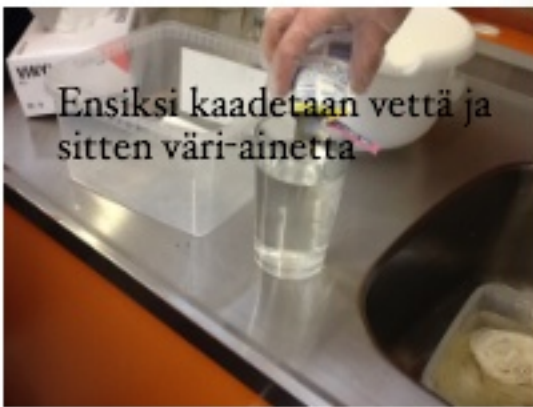
Ensiksi kaadetaan vettä ja sitten väri-ainetta