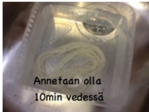
Annetaan olla 10min vedessä