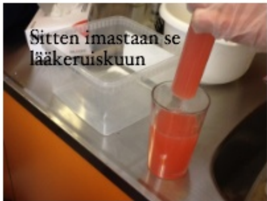
Sitten imastaan se lääkeruiskuun

Sitten ruiskulla värjätään lanka joka on toisessa purkissa