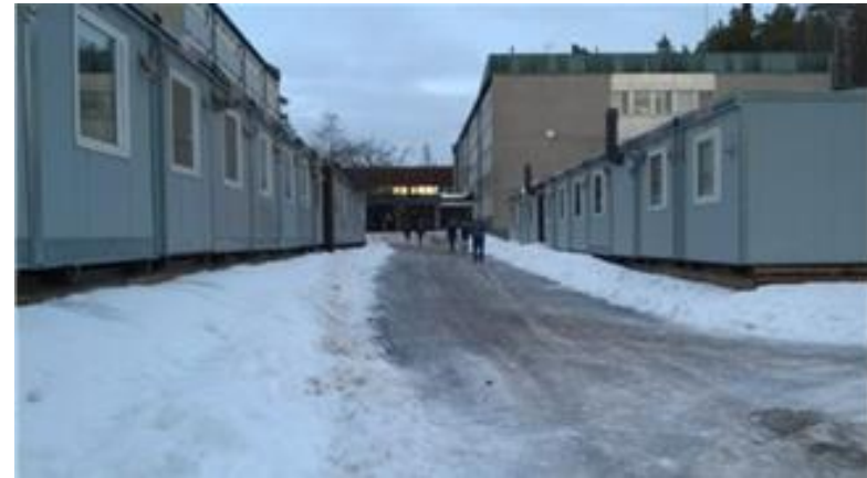
Pilottikohteena Tapiolan koulu

Toimiviksi havaittuja ratkaisuja hyödynnetään muissa väistötiloissa, uusien koulutilojen rakentamisessa, muissa kuntalaisten palvelutiloissa sekä koulukulttuurin muutoksessa.