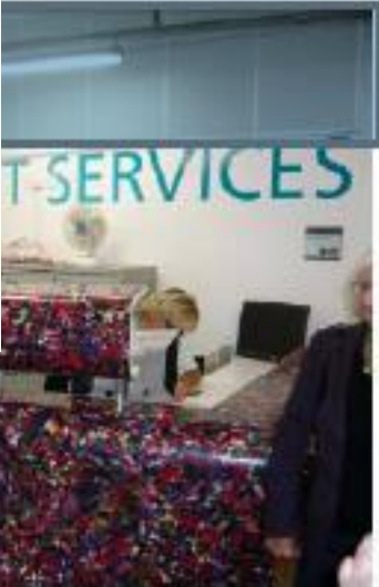
High profile student support