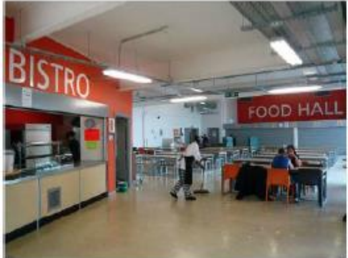
Modern café facilities, split lunch breaks