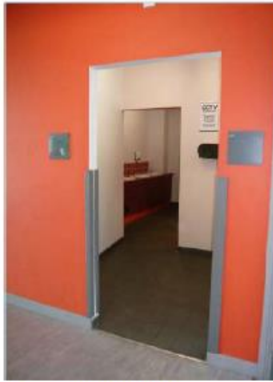
Open, unisex toilets