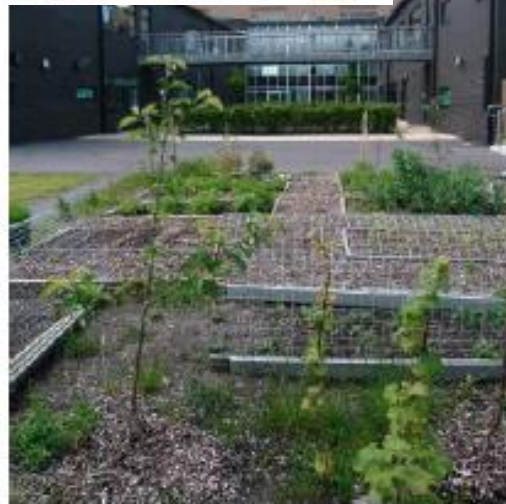
Outdoor classrooms and allotments