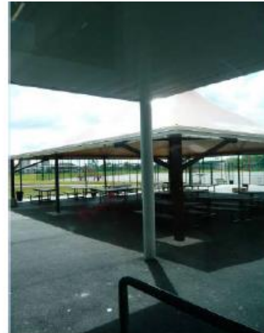
Covered outdoor seating