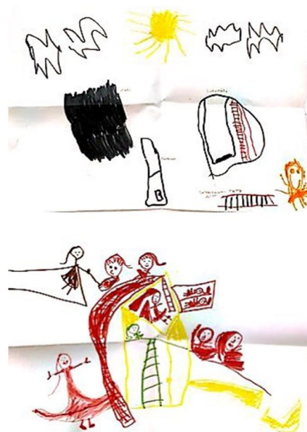
kuva 2. erään kehittämispäiväkodin lasten toiveita ja piirustuksia aiheesta Unelmien päiväkoti, kuva opiskelijoiden keräämästä materiaalista

Opiskelijoiden tekemät havainnot oppimisympäristöistä liittyivät pehmeiden pintojen vähäisyyteen, tilojen heikkoon muunneltavuuteen, tilojen niukkaan värimaailmaan sekä yksipuoliseen valaistukseen, joka ei useinkaan ollut säädettävissä. Päiväkotien henkilöstön toiveissa tilojen muunneltavuus erilaisiin toimintoihin sopivaksi sekä akustiikka nousivat esiin. Lisäksi leikkien ja askartelujen yms. kesken jättämiseen kaivattiin uudenlaisia ratkaisuja, ettei kaikkea tarvitsisi aina kerätä pois.