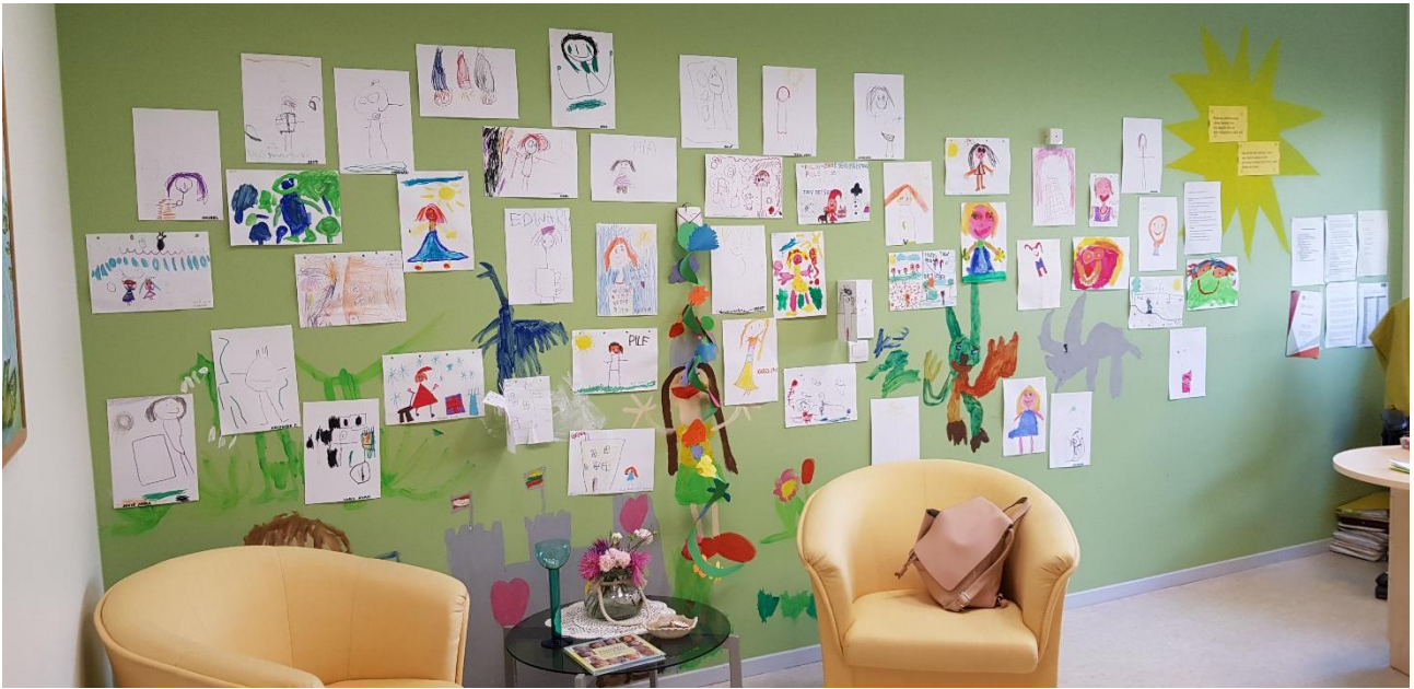
Päiväkodin johtajan, Pilleen työhuone. Lapset ovat vahvasti läsnä.