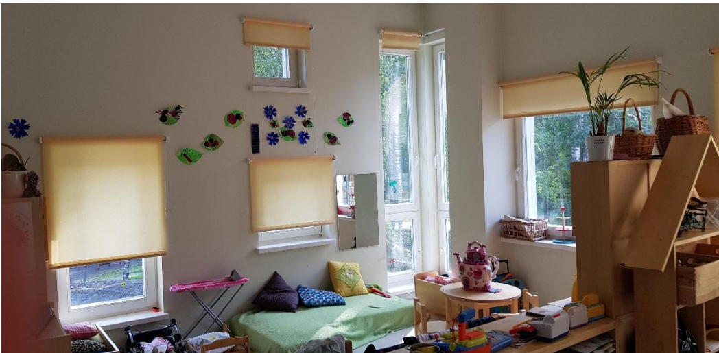
Erikokoisia, muotoisia ja eri tasoissa olevia ikkunoita ryhmätallassa.