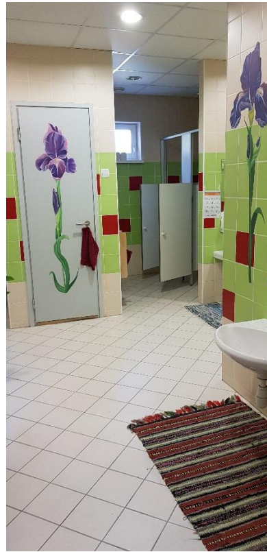
Värikkäitä pintoja, mattoja jopa wc-tiloissa!

Päiväkodin piha oli suuri ja herätti meissä ihastuksen huokauksia. Pihalla oli pitkä seikkailurata. Lisäksi jokaisella ryhmällä oli oma katos, jota lapset olivat saaneet maalata. Päiväkodin kivijalka oli täynnä lasten liiduilla piirtämää taidetta. Pihalta oli kaadettu puita ja puista oli jätetty pitkät kannot. Myös puiden rungot oli vain katkottu pölleiksi ja jätetty lasten käyttöön pihalle. Miten loistavia tarjoumia! Turvallisuutta väheksymättä mieleen tuli että onko Suomessa menty turvallisuusasioissa jo liian pitkälle? Usein ympäristöstä viedään pois kaikki luonnon tarjoumat ja tilalle tuodaan asfalttia ja rakennettuja kiipeilytelineitä.